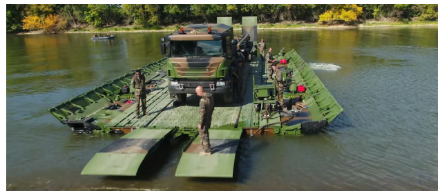
[Défense] Pont Flottant Motorisé (PFM) : une gamme de produits évoluant selon les besoins des Armées.