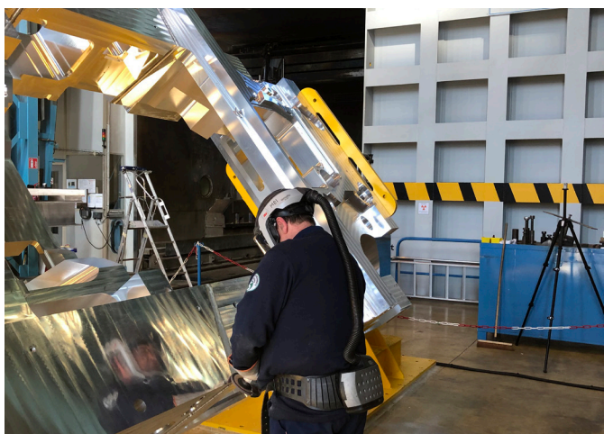
[Semi-conducteurs] Soudage par faisceau d'électron d'un châssis complexe de machines.